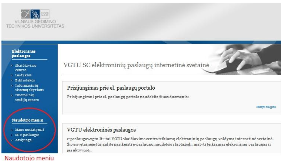
2 pav. Naudotojo meniu

Prisijungus, kairėje pusėje matote Naudotojo meniu ( 2 paveikslėlis)